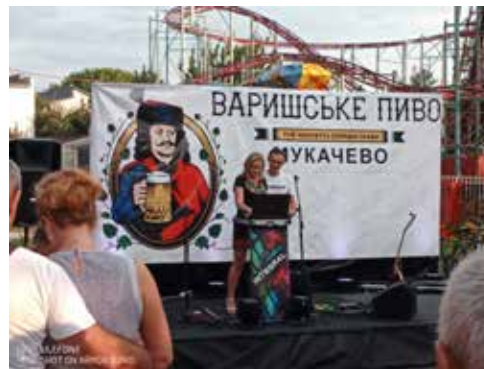
Bierfest in Mukatschewo