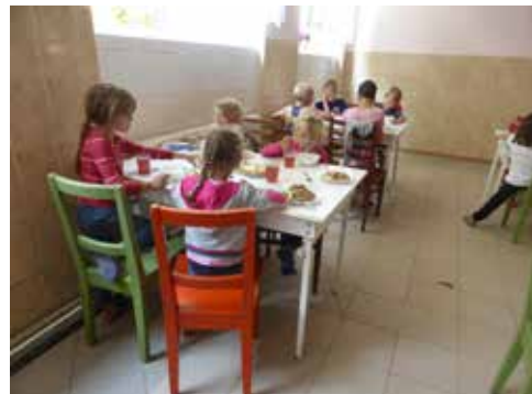
Sattessen im Speisesaal

Die Verwaltungsreform hat große Veränderungen gebracht. Peretschin hat sich ja schon länger die umliegenden Dörfer einverleibt, während die Gebietsreform von Kamjanyzia erst zum Jahreswechsel erfolgte. Hier sind 5 Dörfer unter dem Namen Onokivze zusammengeschlossen, was zusammen über 6000 Bürger und eine Dorflänge von über 10 Kilometern bedeutet. Ob es leicht für die gewählte Bürgermeis-