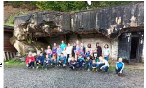
Alle wieder an der Sonne