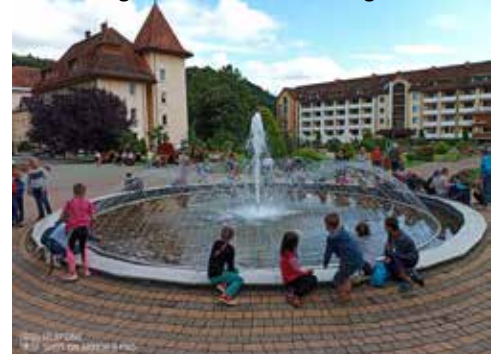
Luschanska Hotel und Mineralwasserfabrik