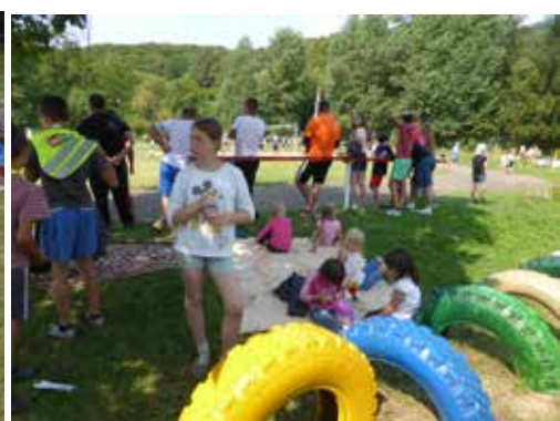
Zuschauen bei Spartakiade