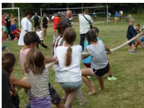
Tauziehen auf der Spatakiade