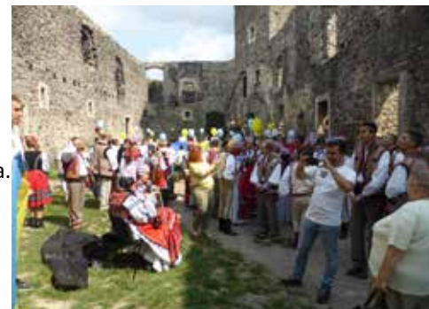
Unabhängigkeitstag auf der Burg