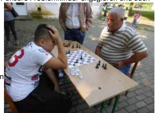
Sieg des Jungen bei Spartakiade