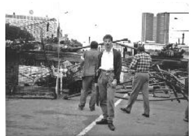
Osterfahrtung seit 1991